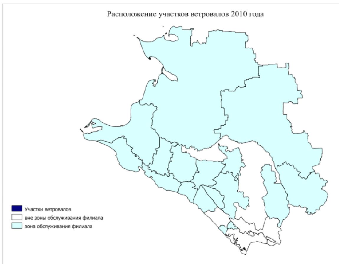
Рисунок П.3 – Карта расположения участков ветровалов 2010 года